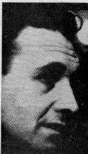
ANDRZEJ WAJDA Vuelta a primer plano

La Asamblea General de la FIAF coexistirá con un doble simposio de modo