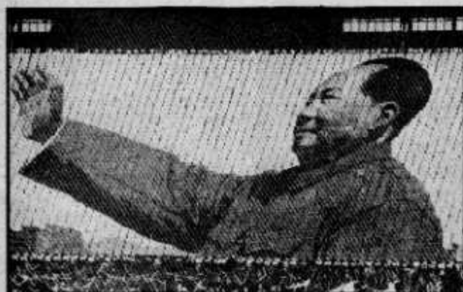
LOS LIOS CHINOS

DE LUSSANET, Paul. — Misterios . Con Sylvia Kristel, Rutger Hauer, David Rappaport, Ingrid Caven, Andréa Ferreol.