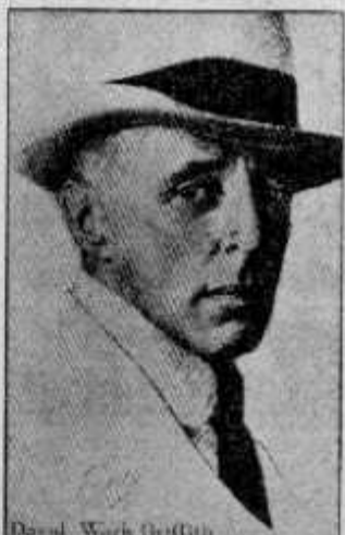
David Griffith GRIFFITH Un aniversario

En 1978 se cumplieron treinta años de la muerte de Sergei Eisenstein (enero 23) y de David Griffith (julio 23). La coincidencia es accidental pero ambos jugaron un papel fundamental en la evolución del lenguaje cinematográfico.