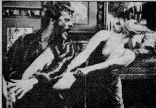
FIN, MUNDO, LLUVIA La Lina en el lecho cotidiano