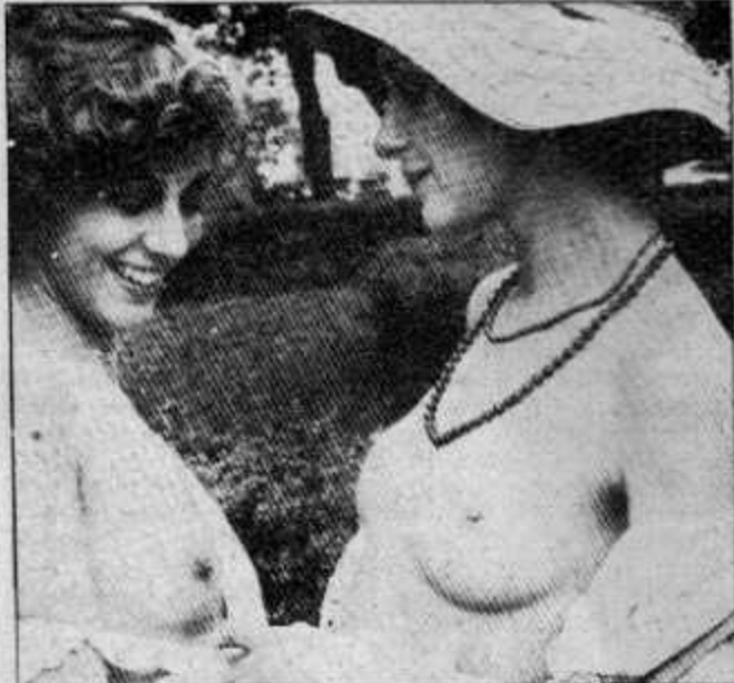
¿DRACULA? Según Paul Morrissey

La Sociedad Stefano de Italia reunió un grupo de films con preocupaciones tan atrevidas como originales para distribuir en su país. Entre los nombres mencionados figuran Alessandro Jodorowski, Paul