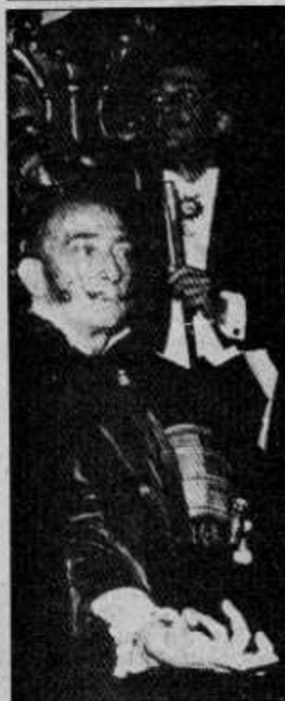
GENIO Y FIGURA Dalí y Dalí