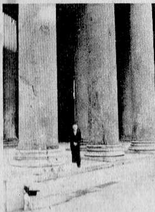
Vittorio De Sica - Umberto D. - 1952