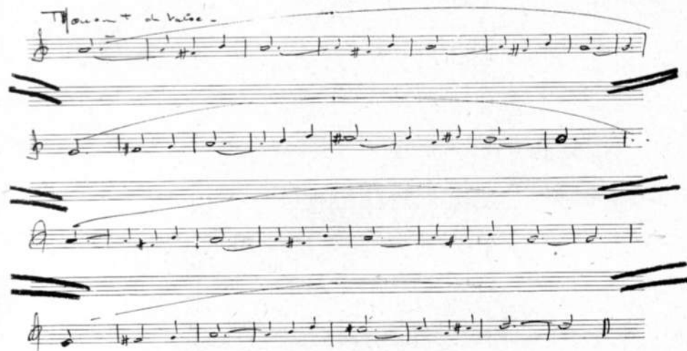
La Valse (autographe de l'auteur).

Les cinq séances d'enregistrement de la musique faisaient appel à piano, flûte, piccolo, clarinette, alto, violoncelle, contrebasse, cor, et une guitare pour deux numéros. Une telle formation, assez peu orthodoxe dans le monde cinématographique, exigeait que l'exécution fût précise et la musique à la fois riche et écrite.